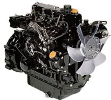
TNV - Serie