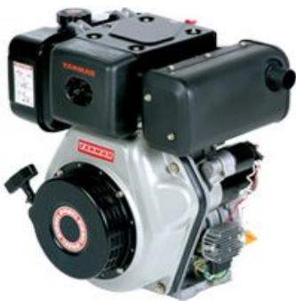
L - N - Serie